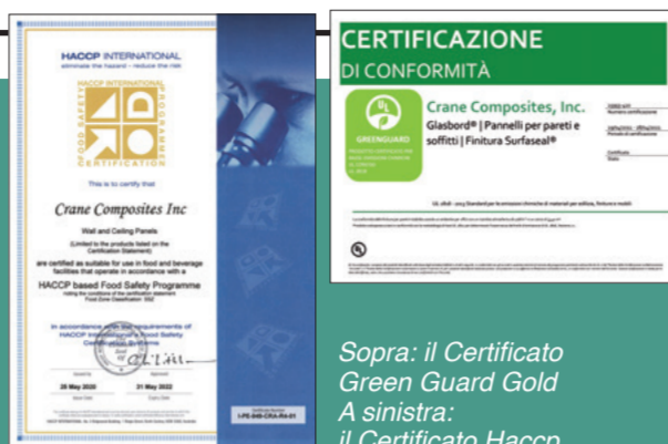
Sopra: il Certificato Green Guard Gold A sinistra: il Certificato Haccp

Sono molti i vantaggi offerti dal Glasbord. L'innovativo materiale di rivestimento della milanese Ferbox. Che trova vasta applicazione nell'industria alimentare. Utilizzato in locali di trasformazione, stagionatura, celle refrigerate o camere bianche.