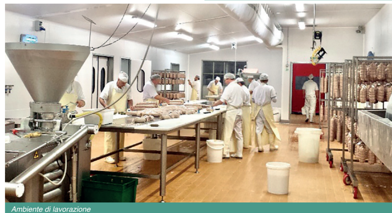
Ambiente di lavorazione